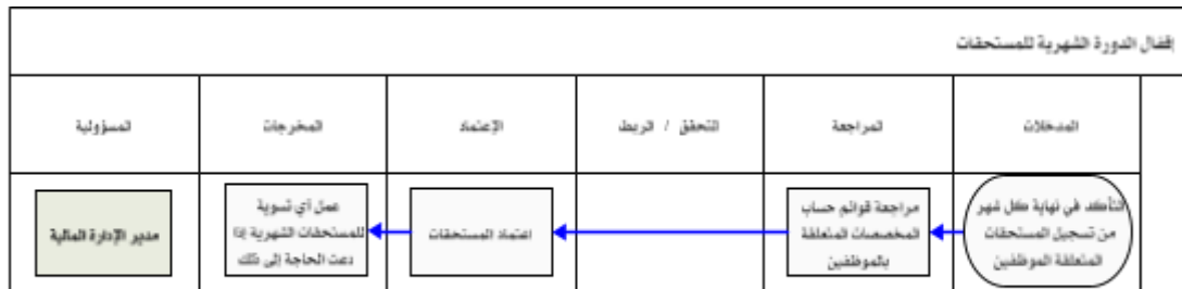
شكل رقم / ٥

يوضح المخطط البياني التالي ( شكل رقم/٥ ) طريقة تسلسل العمل لإقفال الدورة الشهرية للمستحقات: